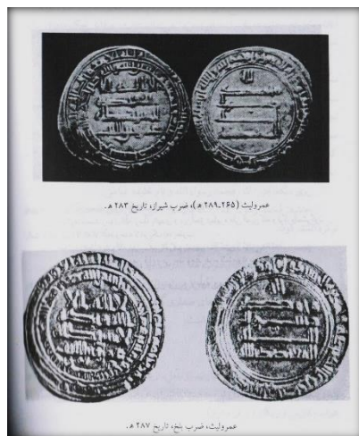
تصویر ۱۴: سکه‌های دوره حکومت صفاریان.

می‌تواند جهت مشروعیت بخشیدن به حملات و حکومت صفاریان بوده باشد. ضرابخانه‌های فارس بخش مهمی از ضرب مسکوکات را در این دوره برعهده داشت، عمر بنلیث، محمد بن عمرو، طاهر بن محمد و لیث بن علی اقدام به ضرب درهم‌هایی با طرح صفاری در این ضرابخانه نمودند (ترابی: همان: ۳۷۱).