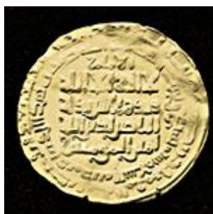
تصویر ۱۱: دینار دوره عباسی، منبع: (شوشتری: ۱۳۳۹).

در آن از خواست و اراده خداوند در کل امور و شاد شدن مؤمنان سخن رفته که اشاره‌ای به انتخاب امام رضا (ع) به ولایتعهدی است. انتخاب امام به عنوان ولیعهدی مامون که با اهداف متعدد سیاسی - مذهبی از جمله دلجویی علویان صورت گرفت با ضرب مسکوکاتی ممتاز به لحاظ خط، طرح و کیفیت در ضربخانه‌های مرو، محمدیه، فارس؛ اصفهان و نیشابور ثبت و ضبط گردید. از این پس، در تمام دوره عباسیان مسکوکات ثابت ماند خلفای عباسی جهت رعایت خلوص مسکوکات، به‌ویژه دینار ضربخانه‌ها را تحت نظارت داشتند. در عصر امویان مسکوکات طلا شامل، نیم‌دینار، ثلث دینار و دینار تمام می‌شد (تراپی، همان: ۲۳). عباسیان ربع دینار و دینارهایی بزرگ‌تر از وزن معمولی دینار ضرب کردند (امامی شوشتری، ۱۳۳۹: ۷۶). (تصویر شماره ۱۱)