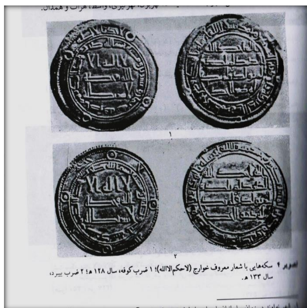
تصویر ۱۷: مسکوکات مربوط به خوارج.

این آیه که پس از نبرد صفین شعار خوارج قرار گرفت به عدم اطاعت و پذیرش حکمی جز حکم خداوند تاکید دارد (شهرستان، ۱۳۵۰: ۸۲).