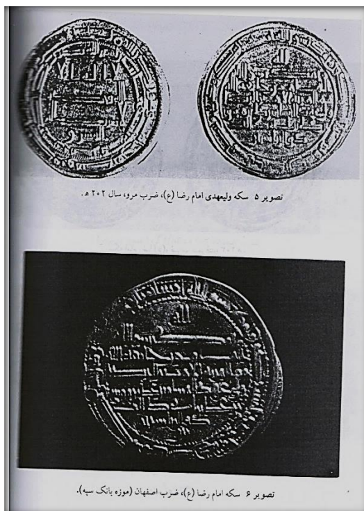
تصویر شماره ۱۰: نمونه‌هایی از مسکوکات دوره امام رضا (ع). موزه بانک سپه.

در آن از خواست و اراده خداوند در کل امور و شاد شدن مؤمنان سخن رفته که اشاره‌ای به انتخاب امام رضا (ع) به ولایتعهدی است. انتخاب امام به عنوان ولیعهدی مامون که با اهداف متعدد سیاسی - مذهبی از جمله دلجویی علویان صورت گرفت با ضرب مسکوکاتی ممتاز به لحاظ خط، طرح و کیفیت در ضربخانه‌های مرو، محمدیه، فارس؛ اصفهان و نیشابور ثبت و ضبط گردید. از این پس، در تمام دوره عباسیان مسکوکات ثابت ماند خلفای عباسی جهت رعایت خلوص مسکوکات، به‌ویژه دینار ضربخانه‌ها را تحت نظارت داشتند. در عصر امویان مسکوکات طلا شامل، نیم‌دینار، ثلث دینار و دینار تمام می‌شد (تراپی، همان: ۲۳). عباسیان ربع دینار و دینارهایی بزرگ‌تر از وزن معمولی دینار ضرب کردند (امامی شوشتری، ۱۳۳۹: ۷۶). (تصویر شماره ۱۱)