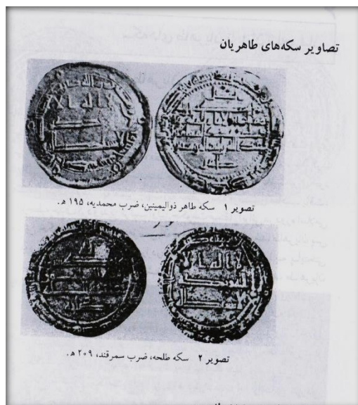
تصویر ۳: سکه های مربوط به دوره طاهریان

اولین مسکوکات متعلق به طاهربن حسین بود. مسکوکات طاهریان با طرحی کاملاً مشابه عباسیان ضرب می شد. (تصویر شماره ۱۲).