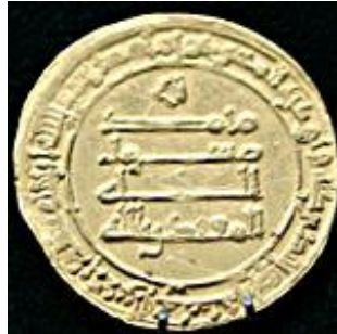
تصویر ۹: سکه دوره مهدی عباسی

تغییرات مسکوکات در دوره عباسی چندان اساسی نبود. عباسیان که با شعار "الرضا من آل محمد" روی کار آمدند به جای سوره اخلاص، شهادت محمد رسول الله (ص) را جایگزین نمودند (نقشبندی، ۱۳۷۲: ۱۳۷). این اقدام عباسیان کوششی آگاهانه جهت انتساب خود به خاندان پیامبر(ص) و تثبیت حکومتشان به عنوان جانشینان آن حضرت بود. به این ترتیب بر یک روی سکه شهادت بر یگانگی خداوند و در سوی دیگر شهادت بر رسالت پیامبر نقش بست. با این تغییر، سفاخ اولین سکه خویش را به سال ۱۳۲ هـ با طرح اموی ضرب کرد (ترابی طباطبایی: ۱۹۴-۱۸۵). منصور نیز پرداخت خراج را با مسکوکات، هبیریه، خالدیه و یوسفیه که از خلوص بالایی برخوردار بودند، مقرر کرد (بلاذری، همان: ۲۲۳؛ ابن خلدون، همان: ۵۰۰؛ نقشبندی، همان: ۱۱۷). باروی کار آمدن مهدی عباسی (۱۶۹-۱۵۸ هجری) نام خلیفه بر سکه‌ها درج شد. (تصویر ۹).