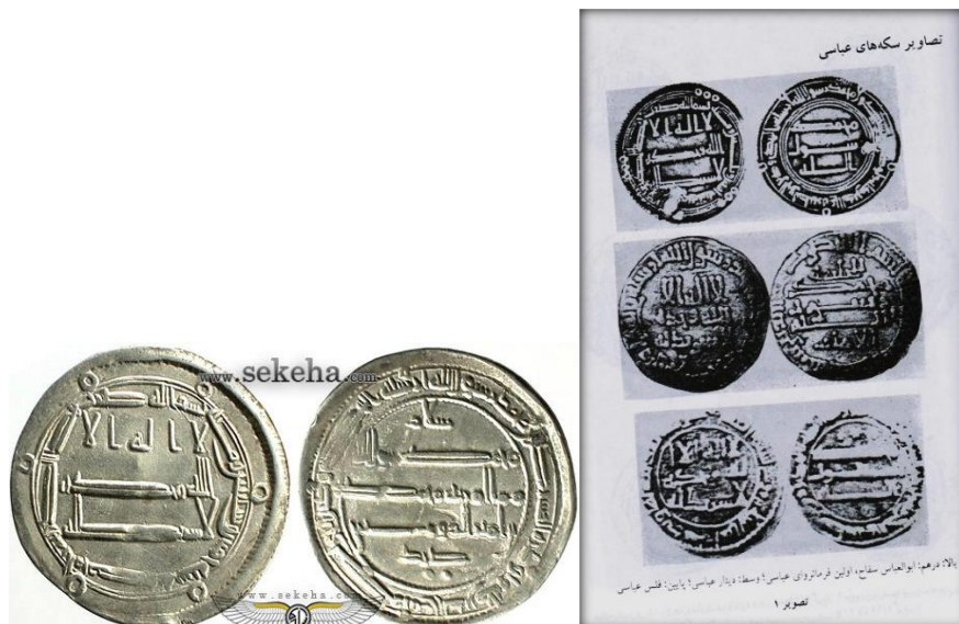
تصویر ۷ و ۸: سکه‌های اوایل دوره عباسی

از سال ۷۷ هجری اصلاحات مذکور منجر به ضرب نوع جدیدی (سکه) که از آن زمان از جانب مسلمانان به عنوان نمونه تعیین شده بود، گردید (اشپولر، ۱۳۷۷: ۲/۲۴۴). در این الگوی جدید که تا پایان عصر عباسی به کار گرفته می‌شد و به قول مایلز حتی بر مسکوکات اروپا نیز تأثیر گذاشت (فرای، کمبریج، ۳۱۹/۴). خطوط جایگزین تصاویر شده و از کلام خداوند برای زینت بخشی متن و حاشیه استفاده می‌شد. خطوط کشیده و استوار کوفی با وضوح تمام در میانه محیط مدور سکه به زیبایی خودنمایی می‌کرد، همین خطوط با انعطاف زیاد به شکل مدور بر حاشیه نقش بسته بودند (تصاویر شماره ۷ و ۸).