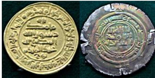
تصویر ۱۶. سکه‌های دوره سامانی.

هرچند این مسکوکات غالباً از نقره خالص نبوده و به لحاظ عیار و ارزش با یکدیگر متفاوت بوده اند، اما به لحاظ طرح، تزیین و نوشته کاملاً شبیه مسکوکات عباسی بودند با این تفاوت که علاوه بر نام خلیفه و امیر سامانی شعارهایی مذهبی مانند " نصر ومن الله و فتح القریب " بر مسکوکات افزوده شده بود که این عبارات غالباً برگرفته از آیات قرآن بودند (سرفراز، همان: ۱۸۹).