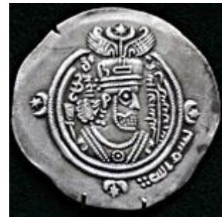
تصویر شماره ۱: مسکوکات دوره عرب ساسانی مانند مسکوکات یزدگرد سوم است فقط با کلمات بسم‌الله- ربی- ربی‌الله در کنار مسکوک.

این سکه‌ها تا ده سال فاقد نام خلیفه یا امرای اسلامی بودند (سرفراز، ۱۳۸۴: ۱۳۷؛ ترابی طباطبایی، ۱۳۷۲: ۳۱۷). در زمان خلافت عمر تنها بسم‌الله و گاه جیدبه سکه‌ها افزوده شد (نقشبندی، ۱۳۸۲: ۲۲). در زمان عثمان (۳۵-۲۳ هجری) تنوعی در لغات دیده می‌شود؛ به این معنا که علاوه بر بسم‌الله کلمات الله، لله، برکه و الملک نیز در مسکوکات به چشم می‌خورد (همان: ۵۵-۵۸). در برخی مسکوکات دوره خلافت حضرت علی (ع) (۴۰-۳۵ هجری) "محمد" جایگزین کلمه بسم‌الله می‌شود (همان: ۶۲).