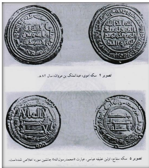
تصویر ۴ و ۵: مسکوکات دوره اموی و اوایل دوره عباسی.

مسکوکاتی با تصویر خلیفه در وسط سکه با دوایری از شمشیر در اطراف ضرب شد (سرفراز، همان: ۱۴۳؛ فرای، ۴/ ۳۱۶) که اعتراض صحابه را بدنبال داشت. این امر موجب امحای بازنمایی‌های تصویری گردید، از این رو، در سال ۷۵ هـ سکه‌هایی با آیات قرآن و بدون نقش ضرب شد (ابن خلدون، همان: ۵۰۱).