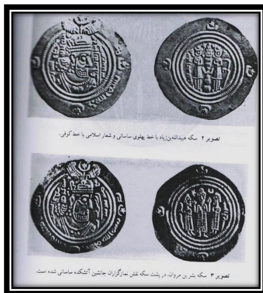
تصویر ۲ و ۳: سکه‌های دور اموی.

همچنین کوشش‌های پراکنده‌ای در زمینه ضرب سکه توسط افرادی چون "زیاد"، "خالد بن ولید"، "عبدالله بن خازم" صورت گرفت (بلاذری، همان: ۲۱۹؛ ماوردی، همان: ۳۱۵). قش این مسکوکات در غالب موارد تنها بسم‌الله بود، جز مسکوکات زیاد که بر آن "بسم‌الله ربی" ضرب شده بود.