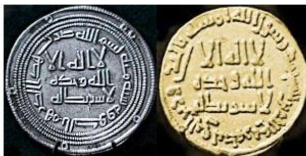
تصویر ۶: مسکوکات دوره عبدالملک اموی. (ابن خلدون: ۱۳۶۹)

مسکوکاتی با تصویر خلیفه در وسط سکه با دوایری از شمشیر در اطراف ضرب شد (سرفراز، همان: ۱۴۳؛ فرای، ۴/ ۳۱۶) که اعتراض صحابه را بدنبال داشت. این امر موجب امحای بازنمایی‌های تصویری گردید، از این رو، در سال ۷۵ هـ سکه‌هایی با آیات قرآن و بدون نقش ضرب شد (ابن خلدون، همان: ۵۰۱).