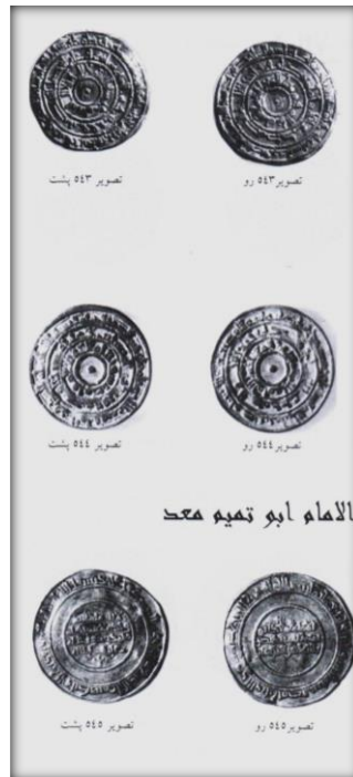
تصویر ۲۱-سکه‌های مربوط به دوره حکومت فاطمیان. منبع: (قوچانی: ۱۳۸۸).

در این مسکوکات خلفای فاطمی خود را "امام" و "امیرالمومنین" می‌نامیدند. خلفای شیعه فاطمی در مخالفت با خلفای سنی مذهب عباسی در ضرب مسکوکات خود علاوه بر ذکر آیاتی که دلالت بر توحید و نبوت داشت، بر اصل اعتقادی خود یعنی امامت، با ذکر عبارت "وعلى الفضل الوصیین و وارث الخیر المرسلین" تاکید می‌ورزیدند. همچنان که الکرملی شرح داده است، بریک روی مسکوکات فاطمیان عبارت "دعاء الام معد لتوحید الاله الصمد" و در حاشیه "بسم الله" و مکان ضرب سکه ضرب زده می‌شد. در برخی از مسکوکات عصر فاطمی مانند مسکوکات المستنصر، الله الصمد حذف شده است (قوچانی، همان: ۲۹۷).