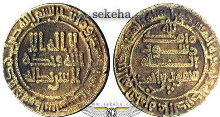
تصویر ۱۵: سکه یعقوب بن احمد سامانی، منبع: (Lane pool)

در زمان سامانیان، علاوه بر درهم‌ها و دینارهای سامانی که از نوع رسمی و قراردادی بودند، مسکوکات گوناگونی در ماوراءالنهر در جریان بود، درهم‌های بزرگ گردش محلی داشتند. درهم‌های غطریفی، اسماعیلی، مسیبی و محمدی از دیگر مسکوکات رایج بودند. این نقود بیشتر جنبه ناحیه‌ای داشته‌اند. درهم محمدی و اسماعیلی در سمرقند، غطریفی در بخارا و نواحی پشت‌رود و مسیبی فقط در بخارا مورد استفاده قرار می‌گرفتند (اصطخری: ۲۴۵-۲۶۵). وجود معادن و کان‌های سیم در نواحی کرمان، سیستان، ماوراءالنهر، عامل اصلی تداوم رواج مسکوکات نقره در شرق به‌شمار می‌روند، این معادن که تأمین‌کننده اصلی نقره مورد نیاز ضرابخانه‌ها بودند، درمقایسه با معادن طلا به مراتب بیشتر مورد بهره‌برداری قرار می‌گرفتند. ضرابخانه‌ها تحت نظارت حکومت‌های محلی اداره می‌شدند (Lane pool - pp ۱۰۱-۲۰۳/۱۰۶، ۱۱۴، ۱۱۹، ۱۲۲، ۱۲۳، ۱۲۴).