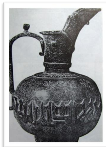
تصویر ۲- پارچ از مفرغ ریختگی، سلجوقی (احسانی، ۱۳۸۶)