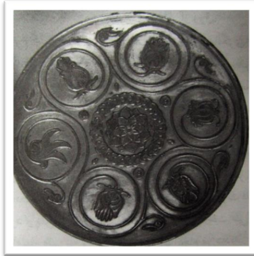
تصویر ۳- بشقاب، ساسانی (حمزه‌لو، ۱۳۸۳).