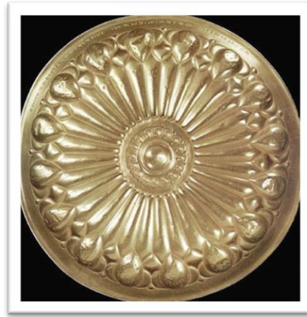
تصویر ۱- بشقاب زرین ساخته‌شده از طلای ناب، سده پنجم ق.م (احسانی، ۱۳۸۶)،

هنر قلم‌زنی که بیانگر فرهنگ و تمدن قوم ایرانی است، در دوره‌های گوناگون، تنوع بالایی را در نوع تزیینات، تکنیک‌های به‌کار رفته، مواد و مصالح به‌کاربرده شده، نوع خط نگاره‌ها و محتوای آثار نشان می‌دهد. (تصویر ۱ تا ۴)