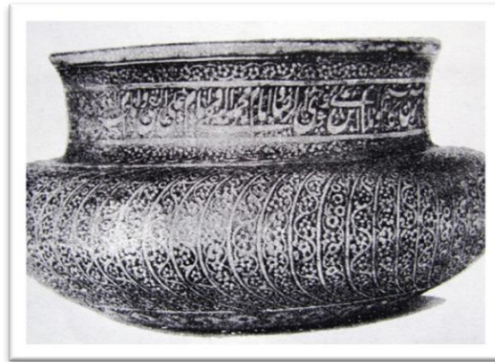
تصویر ۴- ظرف مسی، صفوی (احسانی، ۱۳۸۶).

امروزه با توجه به افزایش جمعیت، هجوم ماشین، تولید انبوه و ارزان همه گونه کالا، کمبود مواد اولیه محلی و تغییرات الگوهای مصرف، صنایع دستی و محصولات آن با همه ارزش و اهمیتی که دارد از رونق زیاد و مورد انتظاری حتی در محیط‌های هنری مانند اصفهان برخوردار نیستند و اگر این شرایط ادامه یابد، خطر رکود بیشتر و حتی نابودی کامل آن می‌رود (صرامی، ۱۳۸۴: ۵۱). حال با چنین شرایط حساس کنونی که جهان از بحران گسترده تخریب محیط‌زیست و نابسامانی‌های اقتصادی در رنج است، ارایه راهکارهایی برای پشتیبانی از آن دسته از عوامل معنوی و اجتماعی که پشتوانه حیات و سلامت جامعه می‌باشند، ضروری است (آریا، ۱۳۸۱: ۲۹).