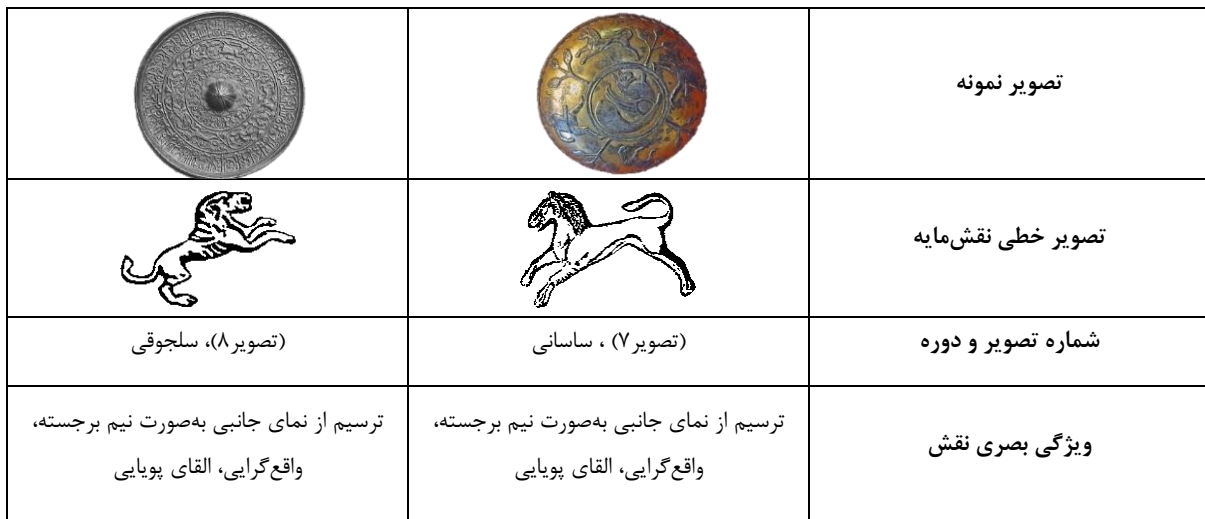
جدول ۵ - تطبیق نقش مایه شیر در صحنه تعقیب و گریز دو دوره ساسانی و سلجوقی (نگارندگان)