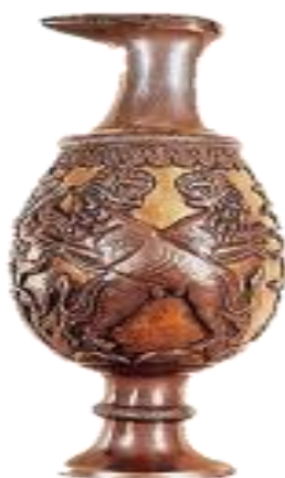
تصویر ۱- تنگ نقره زراندود، دوران ساسانی، کتابخانه ملی فرانسه.

هماهنگی با بدنه و فرم ظرف بوده است و نوعی توازن را القاء می‌نماید. کاربرد این نقش‌مایه در این اثر به‌منظور بیان نمادین و اسطوره‌ای است (تصویر ۱).