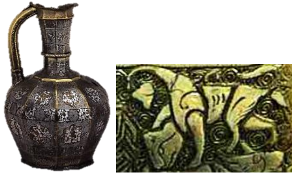
تصویر ۱۴- ابریق بلاکاز، موصل، دوره سلجوقی، موزه بریتانیا.

اثر تنها بیان جنبه نمادین این نقش مایه در قالبی تزیینی بوده باشد. جزئیات خاصی در شیر بالدار موجود در این نمونه به چشم نمی‌خورد و این نقش مایه بخشی از کل نقوش تزیینی فراوان بکار رفته در این اثر است (تصویر ۱۴).