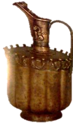
مأخذ: (حیدریان، ۱۳۹۳: ۱۸۳) تصویر ۱۲- تنگ برنجی، دوره سلجوقی، موزه رضا عباسی.

تنگ برنجی متعلق به دوره سلجوقی یافت شده است که به نظر می‌رسد بی‌شبهت به نمونه‌های دوران ساسانی نیست. در این نمونه نقش شیر نر بر دهانه ظرف به صورت نشسته و به آسودگی دیده می‌شود. بدن شیر همچون نمونه ساسانی به حالتی واقع‌گرایانه و ساکن، به صورت نیم برجسته و بدون جزئیات حک شده است. انحنای خطوط پیرامون بدن شیر کاملاً در هماهنگی با انحنای دهانه وجود آمده‌اند. در قسمت پایین‌تر دور ابتدای بدنه ظرف، پرنده‌گانی تخیلی دیده می‌شود که شاید بتوان گفت بی‌ارتباط با نقش نگهبان بودن موجودات بالدار نباشد. در این نمونه همچون نمونه ساسانی بر قسمت سر و یال شیر با پرداخت به جزئیات تأکید بیشتری صورت گرفته و شکوه و جلوه این حیوان به خوبی نمایان است. همچنین شیر در قسمت بالای ظرف قرار گرفته و شاید بتوان گفت به این طریق بالاتر بودن مقام و منزلت شیر هدف بوده است (تصویر ۱۲).