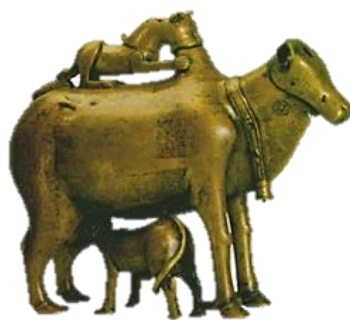
تصویر ۴- آبریز برنجی، دوره سلجوقی، موزه ارمیتاژ.

در قرون پنجم و ششم هجری شاهد کاربرد نقش‌مایه شیر در قالب ظروف هستیم که یکی از نمونه‌های برجای مانده از آن، آبریز برنزی نقره‌کوبی است که به خراسان بزرگ تعلق دارد. در این اثر همچون نمونه دوره ساسانی، مضمون حمله شیر به گاو به کار رفته است با این تفاوت که این بار در قالب فرم نمایان شده‌است. در این شیء نیز شیر هم جهت با بدن گاو به آن حمله‌ور شده، اما صورت شیر به حالت نیم‌رخ بوده و نیز پنجه‌ها و دندان آن بر کوهان گاو فرو رفته است. آناتومی بدن حیوان به شکل ساده و به صورت تجریدی به نمایش درآمده است. در ضمن در این نمونه از هیجان و سببیتی که در نمونه قبل دیده شد با به کاربردن گوساله‌ای که بی‌خبر از آنچه در اطرافش می‌گذرد و آسوده‌خاطر در حال نوشیدن شیر می‌باشد، کاسته شده است. کل ترکیب، حالتی ایستا و ساکن را القاء می‌نماید. آنچه در هر دو اثر به طرز چشمگیر محسوس است این موضوع است که گویی این درگیری و حمله باید اتفاق می‌افتاد و از جانب شکار هیچ مقاومت و نارضایتی احساس نمی‌شود. بنابراین می‌توان گفت این نمونه همچون نمونه‌های باستانی به بهترین نحو، فلسفه دور چرخش در زندگی و توأم بودن زندگی و مرگ را در باور ایرانیان به نمایش می‌گذارد (تصویر ۴).