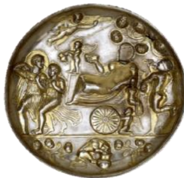
تصویر ۵ - بشقاب نقره، دوران ساسانی موزه ارمیتاژ. مأخذ: (درگاه اینترنتی موزه ارمیتاژ)

جام، ترسیم و به صورت نیم برجسته بر ظرف حک شده است. دست‌ها و یک پای شیر بر بدنه جام و به حالت بالا رفتن از آن قرار گرفته است و این گونه نقش شیر پویایی و جنبش را به بیننده القاء می‌نماید (تصویر ۵).