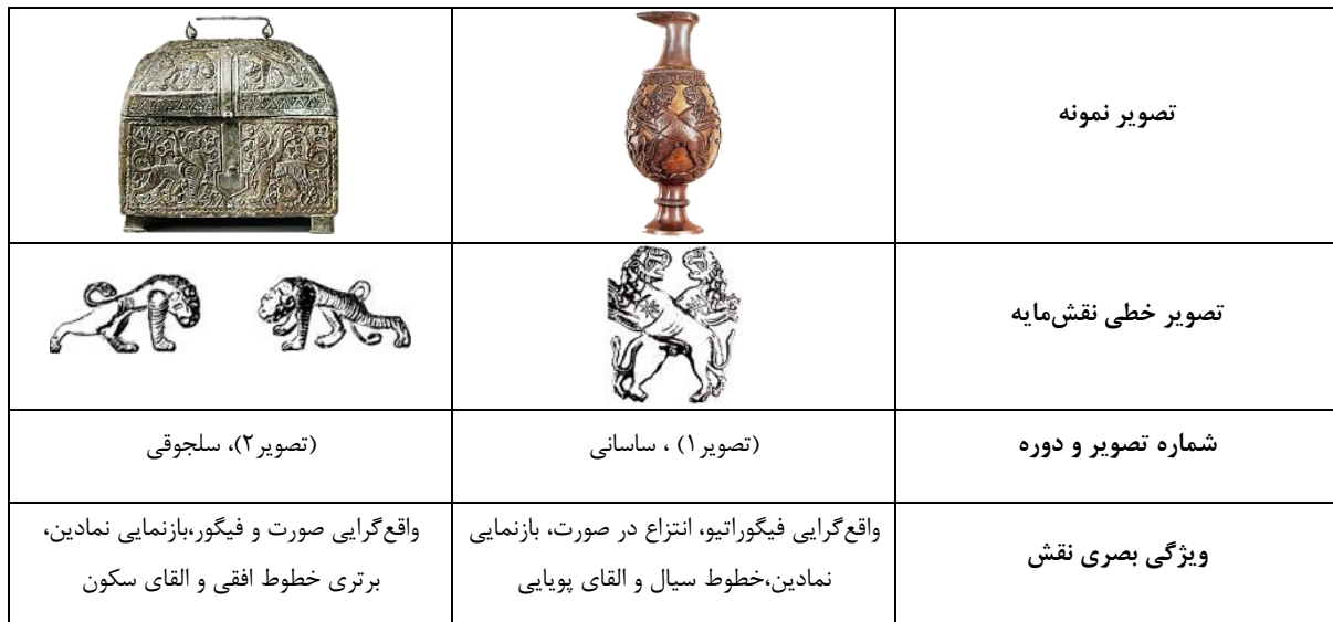
جدول ۲- تطبیق نقش مایه شیر در ترکیب قرینه دو دوره ساسانی و سلجوقی (نگارندگان)