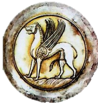
تصویر ۱۳- جام نقره، دوران ساسانی، موزه کانزاس سیتی. مأخذ: (دادور، ۱۳۹۳: ۳۳۰)

نقش شیر گاهی به صورت ترکیبی با اجزای بدن حیوانات دیگر در آثار فلزی دوران ساسانی دیده شده است و در دوران اسلامی تداوم این سنت تصویرپردازی به چشم می‌خورد. یکی از این موارد ترکیب شیر بالدار است. هنرمند فلزکار در دوران ساسانی با افزودن بال بر بدن شیر و نشان دادن درنده‌خویی و خشم در چهره آن، در واقع سعی در نمایش وجود نیروهای شیطانی و ماوراءالطبیعه آن نموده است. در این دوره شیر بالدار در آثار فلزی اکثراً به صورت منفرد دیده شده است و احتمالاً وجود این نقش‌مایه بر روی ظروف تجملی انعکاس ذوق و میل جامعه به داستان‌های افسانه‌ای باستانی باشد (گیرشمن، ۱۳۷۰: ۲۱۹). جامی از جنس نقره متعلق به این دوره موجود است که در این شیء، درنده‌خویی شیر از طریق زبان بیرون آمده از دهان و پرداختن به جزییات در صورت شیر آشکار است. ترسیم بدن انتزاعی و ایستا است و در کادر دایره‌ای مرکز ظرف صورت گرفته است. در قسمت اتصال بال بر بدن شیر، نقش گیاه مانند پیچکی با جزییات مشاهده می‌شود. می‌توان این نکته را اضافه نمود که با ذکر جزییات در سر و بال شیر بر ماوراءالطبیعه بودن آن تأکید بیشتری شده است (تصویر ۱۳).