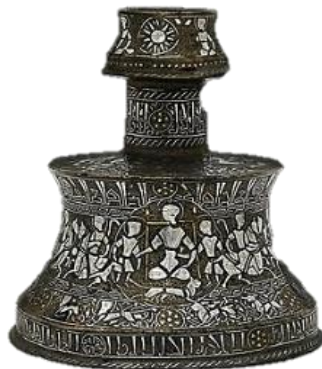
تصویر ۶ - شمعدان برنجی ترصیع یافته، دوره سلجوقی، گالری کریستی. لندن.

است. در این اثر پادشاهی نشسته بر تخت و ملازمانش در اطرافش به چشم می‌خورند. نقش شیری در حال دویدن پایین تخت دیده می‌شود که در کادر مدالیون دایره‌ای همراه پادشاه قرار دارد. احتمالاً در ادامه کاربرد این نقش با مفهوم حافظ و نگهبان سلطنت، در دوران اسلامی است. همچنین نقشی خورشید مانند در دهانه شیء دیده می‌شود که همچون نمونه قبل می‌تواند به نماد خورشید بودن شیر اشاره داشته باشد. نقش شیر در این شیء همچون بسیاری از نمونه‌های دوره سلجوقی به صورت سطوح مثبت و منفی و به شکلی کاملاً ساده و بدون جزئیات در اجزای بدن، ایجاد شده است. نقش این حیوان از نمای جانبی و به صورت کشیده به نمایش در آمده است. برجستگی نمونه ساسانی را ندارد، اما جنبش و تحرک در بدن شیری که در حال دویدن است دیده می‌شود (تصویر ۶).