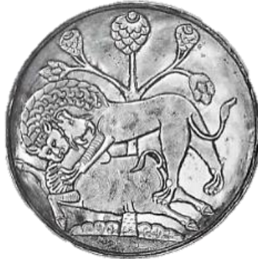
تصویر ۳- بشقاب نقره، دوران ساسانی، موزه ارمیتاژ.

در قرون پنجم و ششم هجری شاهد کاربرد نقش‌مایه شیر در قالب ظروف هستیم که یکی از نمونه‌های برجای مانده از آن، آبریز برنزی نقره‌کوبی است که به خراسان بزرگ تعلق دارد. در این اثر همچون نمونه دوره ساسانی، مضمون حمله شیر به گاو به کار رفته است با این تفاوت که این بار در قالب فرم نمایان شده‌است. در این شیء نیز شیر هم جهت با بدن گاو به آن حمله‌ور شده، اما صورت شیر به حالت نیم‌رخ بوده و نیز پنجه‌ها و دندان آن بر کوهان گاو فرو رفته است. آناتومی بدن حیوان به شکل ساده و به صورت تجریدی به نمایش درآمده است. در ضمن در این نمونه از هیجان و سببیتی که در نمونه قبل دیده شد با به کاربردن گوساله‌ای که بی‌خبر از آنچه در اطرافش می‌گذرد و آسوده‌خاطر در حال نوشیدن شیر می‌باشد، کاسته شده است. کل ترکیب، حالتی ایستا و ساکن را القاء می‌نماید. آنچه در هر دو اثر به طرز چشمگیر محسوس است این موضوع است که گویی این درگیری و حمله باید اتفاق می‌افتاد و از جانب شکار هیچ مقاومت و نارضایتی احساس نمی‌شود. بنابراین می‌توان گفت این نمونه همچون نمونه‌های باستانی به بهترین نحو، فلسفه دور چرخش در زندگی و توأم بودن زندگی و مرگ را در باور ایرانیان به نمایش می‌گذارد (تصویر ۴).