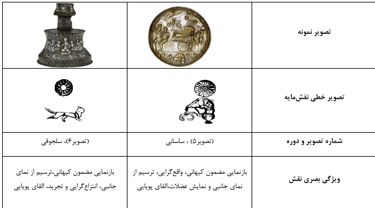
جدول ۴ - تطبیق نقش مایه ترکیب شیر و خورشید دو دوره ساسانی و سلجوقی (نگارندگان)

با وجود بررسی‌های فراوان در نمونه آثار فلزی بجای مانده از دوره سلجوقی، صحنه شکار شیر توسط انسان دیده نشده است. اما صحنه تعقیب و گریز شیر به همراه حیوانات دیگر یافت شده که از جمله آن‌ها می‌توان به قاب آینه مفرغی متعلق به این دوره اشاره کرد. نقش شیری که در این شیء به کار رفته، از لحاظ ترسیم بدن حیوان در حالت دویدن و واقع‌گرایی ظاهری، شباهت بسیاری به نمونه ساسانی دارد. تنها تفاوت در این موضوع است که در اینجا شیر شکار نیست بلکه شکارگر است و در تعقیب گوزنی در حال گریز است و این صحنه همچون نمونه ساسانی در حاشیه تزئینی پیرامون مرکز ظرف به نمایش درآمده است (تصویر ۸).