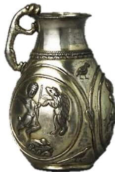
تصویر ۹- تنگ آبخوری، نقره، دوران ساسانی، موزه هنر کلیولند.

نمونه‌ای از مضمون مذکور به جای مانده از دوره سلجوقی ابریق برنزی متعلق به خراسان است. در این اثر مانند نمونه قبل کاربرد فرم نقش شیر به عنوان دسته ظرف دیده می‌شود. شیر بکار رفته در این مورد، از ابتدای دهانه تا انتهای بدنه ظرف کشیده شده است و این کشیدگی و انحنا را اغراق شده تقریباً به این حیوان صورتی انتزاعی بخشیده است. در ضمن با وجود اتصال دست‌ها و پاهای شیر همچون نمونه مربوط به دوران ساسانی، در اینجا دهان شیر بر دهانه ظرف قرار نگرفته است که ممکن است به دلیل کاربرد متفاوت این ظرف نسبت به نمونه قبل باشد. ورودی و خروجی آب در این ظرف مجزا است و احتمالاً با قرارگیری دهان شیر بر ورودی آب، خللی در سهولت کاربرد آن ایجاد می‌شده است. اما می‌توان گفت سازنده در انتقال شیوه نقش‌پردازی مورد نظر موفق بوده است. از آنجایی که در دوره سلجوقی تزیینات گیاهی به وفور در ترکیب با نقوش جانوری بکار رفته، در این مورد نیز کل بدنه شیر با نقوش گیاهی تزیین شده است. در رابطه با فرم شیر در این اثر می‌توان اضافه نمود که نوعی پویایی همراه باصلابت، در هماهنگی با بدنه ظرف نسبت به اثر قبل به نظر می‌رسد (تصویر ۱۰).