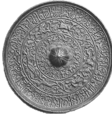
تصویر ۸ - قاب آیینه مفرغی، دوره سلجوقی، موزه متروپولیتن.