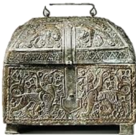
تصویر ۲- صندوقچه برنجی، خراسان، دوره سلجوقی، موزه متروپولیتن.

شیء دوم صندوقچه برنجی متعلق به دوران سلجوقی و ایالت خراسان است. در این اثر نیز نقش‌مایه شیر با ترکیب‌بندی متقارن دیده می‌شود با این تفاوت که طرح به‌صورت مجزا و در کادر تزیینی قرار گرفته است. همچنین هر دو شیر به یک‌شکل روی چهار دست‌وپا ایستاده و بدین ترتیب پویایی و تحرک بیشتر جای خود را به سکون داده است. جزییات نقش به‌صورت نیمه برجسته ایجاد شده و حالت خطی کمتری دارد. صورت هر دو شیر از نمای روبرو و به حالت واقع‌گرایانه و بدن‌ها از نمای جانبی ترسیم شده است (تصویر ۲).