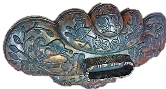
تصویر ۱۱ - بشقاب لبه‌دار نقره زراندود، دوران ساسانی، موزه ارمیتاژ.

نمونه‌هایی از کاربرد شیر در زمینه طبیعت و نقوش گیاهی وجود دارد که به نظر می‌رسد علاوه بر جنبه تزئینی‌اش، مفاهیم نمادین خود را حفظ کرده باشد. به‌عنوان مثال، بشقاب لبه‌دار از جنس نقره زراندود متعلق به دوران ساسانی یافت شده است که در این اثر شیر نری به حالت نشسته وجود دارد که به همراه نقوش حیوانی تخیلی شیردال و نقوش واقعی بزکوهی دیده می‌شود. از آنجایی که وجود بال بر بدن حیوان آن را نمادی از حفاظت و در حکم موجودی نگهبان می‌نماید می‌توان حدس زد که این دو موجود (شیردال) در نقش محافظ شیر به کار رفته‌اند و شیر هم احتمالاً نماد سلطنت است. شیر در زمینه‌ای با نقوش مختصر گیاهی به صورت واقع‌گرایانه و ساکن نشسته است. ترسیم این حیوان در این شیء در کادر دایره‌ای لبه ظرف و فارغ از جزئیات است و خطوط منحنی بدنش در هماهنگی با فرم منحنی ظرف است (تصویر ۱۱).