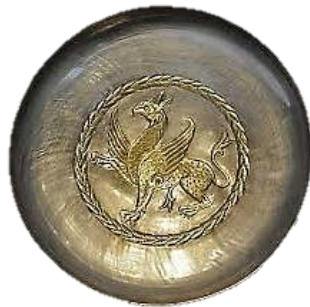
تصویر ۱۵- بشقاب نقره زراندود، دوران ساسانی، موزه ارمنستان.

در دوران ساسانی موجودی ترکیبی به نام شیردال (گریفین) ۲ در آثار فلزی به جای مانده از این دوره به طور قابل توجهی قابل مشاهده است. شیردال ترکیبی از بدن و دم شیر با بال، منقار و پنجه‌های عقاب است. این موجود عجیب الخلقه دارای اصل و نسبی باستانی است که نمونه‌هایی از آن در افسانه‌ها و هنر بین‌النهرین، مصر، یونان، هند و ایران مشاهده شده است (Haskins, ۱۹۸۶: ۳۰۸). در ایران باستان عقاب به‌عنوان تیز پروازترین و قدرتمندترین پرنده آسمان نشانگر عقاید مذهبی بوده و با بال‌های گسترده خود، نشانه برتری، حمایت و مظهر خدایی توانایی بوده است. بنابراین شیردال ترکیب سلطان آسمان‌ها با سلطان زمین محسوب می‌شود (حسینی، ۱۳۹۱: ۵۲) هم عقاب و هم شیر از دوران باستان نمادهای خورشید بوده‌اند. شیردال قدرت شاهانه و نیروی لایزال برتری را القاء نموده و همچنین محافظ و نگهبان بوده است. با این اوصاف می‌توان گفت موجودی خوش‌یمن محسوب می‌شده است و این موضوع را می‌توان از استفاده فراوان آن در ظروف ساسانی دریافت. بشقاب نقره متعلق به دوران ساسانی با این نقش مایه موجود است که در این نمونه شیردال با جزئیات کامل در کادر دایره، بر مرکز ظرف حک و از طریق زراندود کردن به طرح حالتی نیم برجسته بخشیده شده است. گوش‌های دراز تیز، نوک سخت خمیده، بال‌های شیاردار و پنجه‌های تیز همگی حکایت از نیروی این موجود افسانه‌ای دارند. پایین‌تنه کشیده و ایستادن روی یک دست نوعی صلابت را القاء نموده و همین‌طور دست دیگر که بالا و روبه‌جلوست گویی آمادگی برای یورش و جنبش را می‌نمایاند (تصویر ۱۵).