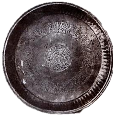
تصویر ۱۶- سینی مسی، دوره سلجوقی، موزه ویکتوریا و آلبرت لندن. مأخذ: (محمدحسن، ۱۳۷۷: شکل ۱۴۳)

نمونه‌ای شبیه به نمونه ساسانی با نقش شیردال که از دوره سلجوقی به جای مانده سینی مسی است که در آن همچون نمونه قبل شیردال در مرکز زمینه و در مدالیونی دایره‌ای جای گرفته است و حالت بدن، همچون بشقاب ساسانی، از نیمرخ و با جزییات است. اما آنچه در این اثر متفاوت به نظر می‌رسد ایستادن شیردال روی دست‌ها و پاهایش، همچنین خمیدگی بیشتر منقار و انتهای بال‌ها است. در اینجا مطابق سنت تصویری مرسوم دوره سلجوقی نقش بر زمینه گیاهی درهم تافته، با خطوط محیطی کاملاً منحنی و سیال بر سطح ظرف ظرف حک شده است (تصویر ۱۶).