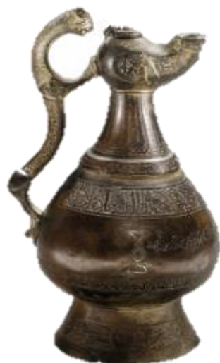
تصویر ۱۰- ابریق برنزی، خراسان، دوره سلجوقی، موزه متروپولیتن.

نمونه‌ای از مضمون مذکور به جای مانده از دوره سلجوقی ابریق برنزی متعلق به خراسان است. در این اثر مانند نمونه قبل کاربرد فرم نقش شیر به عنوان دسته ظرف دیده می‌شود. شیر بکار رفته در این مورد، از ابتدای دهانه تا انتهای بدنه ظرف کشیده شده است و این کشیدگی و انحنا را اغراق شده تقریباً به این حیوان صورتی انتزاعی بخشیده است. در ضمن با وجود اتصال دست‌ها و پاهای شیر همچون نمونه مربوط به دوران ساسانی، در اینجا دهان شیر بر دهانه ظرف قرار نگرفته است که ممکن است به دلیل کاربرد متفاوت این ظرف نسبت به نمونه قبل باشد. ورودی و خروجی آب در این ظرف مجزا است و احتمالاً با قرارگیری دهان شیر بر ورودی آب، خللی در سهولت کاربرد آن ایجاد می‌شده است. اما می‌توان گفت سازنده در انتقال شیوه نقش‌پردازی مورد نظر موفق بوده است. از آنجایی که در دوره سلجوقی تزیینات گیاهی به وفور در ترکیب با نقوش جانوری بکار رفته، در این مورد نیز کل بدنه شیر با نقوش گیاهی تزیین شده است. در رابطه با فرم شیر در این اثر می‌توان اضافه نمود که نوعی پویایی همراه باصلابت، در هماهنگی با بدنه ظرف نسبت به اثر قبل به نظر می‌رسد (تصویر ۱۰).