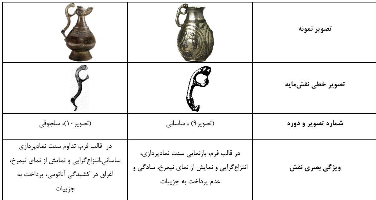
جدول ۶ - تطبیق نقش‌مایه شیر به صورت دسته ظروف دو دوره ساسانی و سلجوقی (نگارندگان)