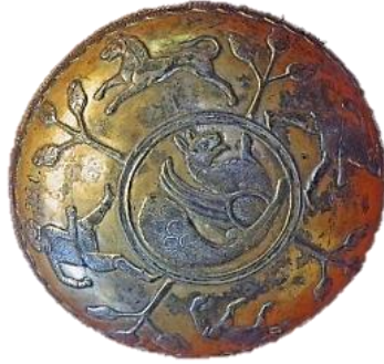
تصویر ۷- بشقاب نقره زراندود، دوران ساسانی، موزه ارمیتاژ.