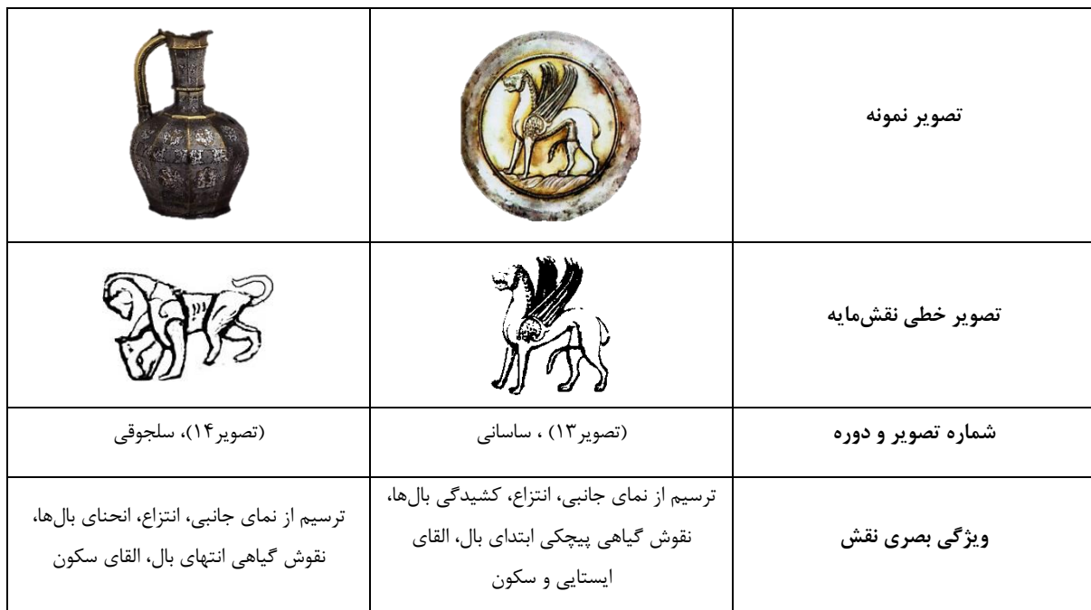
جدول ۸ - تطبیق نقش مایه شیر به صورت شیر بالدار دو دوره ساسانی و سلجوقی (نگارندگان)